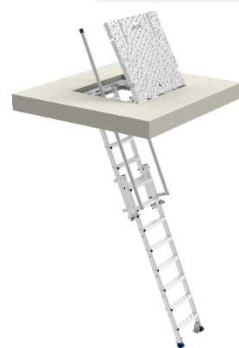
Réf. MAD 3 SKD T