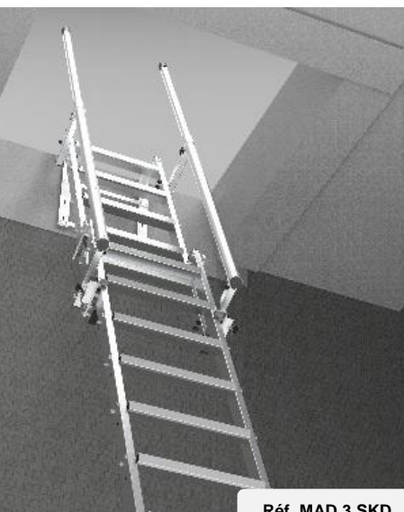
Réf. MAD 3 SKD