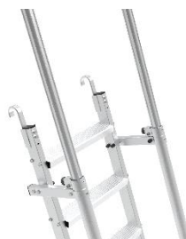
Réf. MAD PLATINE

Platines d'appui à spiter pour décalage du MAD